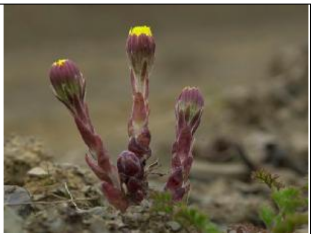
Les fleurs viennent avant les feuilles